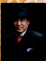
木下 大輔 (作曲)