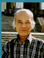
龍眼 義治 (作曲)