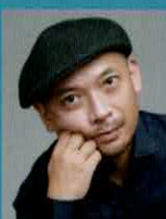
金益 研二 (作曲)