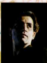
Rouhollah Kalami (作曲)