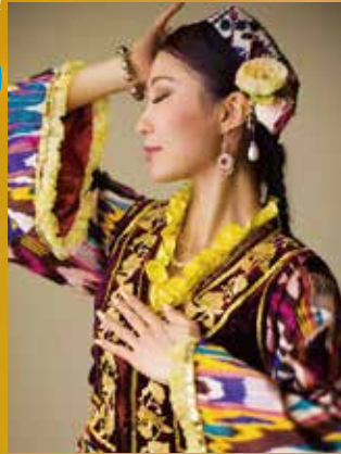
アーニャ(ウズベクダンス)