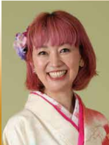
琉水亭はなび(英語で落語)