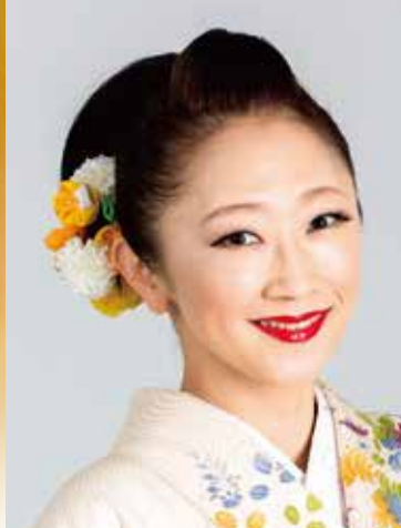
柿崎竹美(日本民謡歌手)