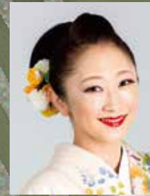
柿崎竹美(日本民謡歌手)